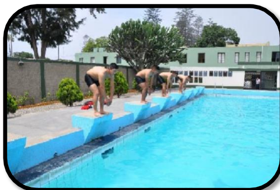
PRUEBA DE NATACIÓN