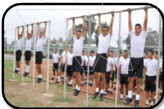
PRUEBA DE BARRAS